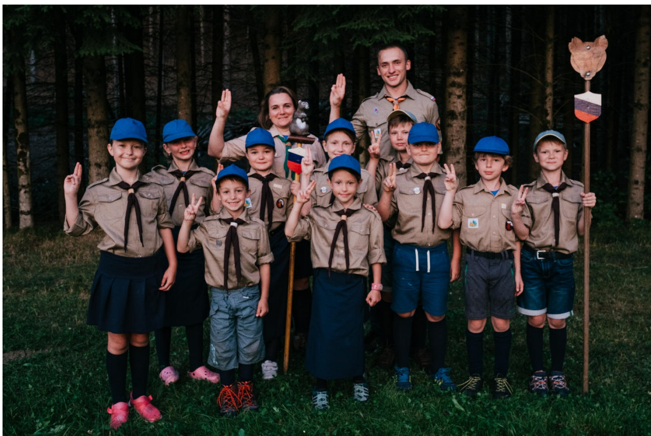
стая после обещания