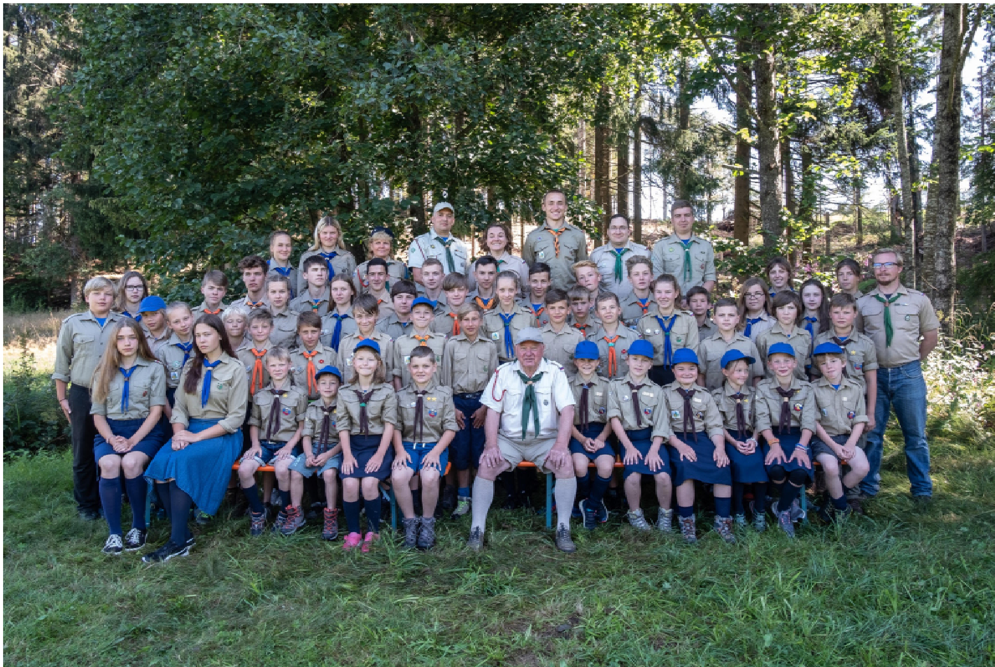
В красивой и холмистой местности ...