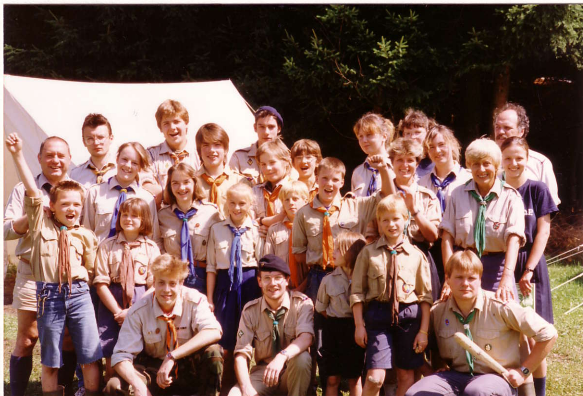
Довольные лагерники в день отъезда