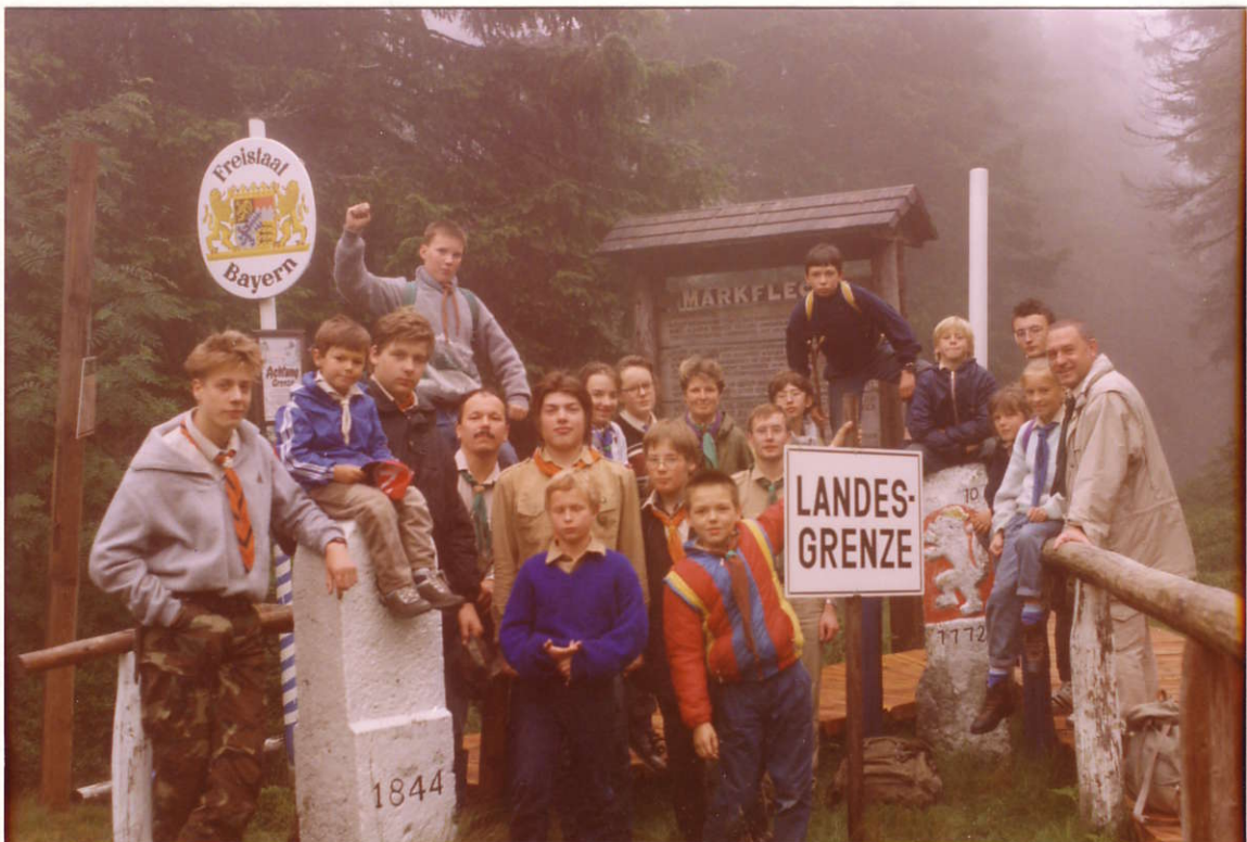
Поход к теперь уже бывшему "Железному занавесу"