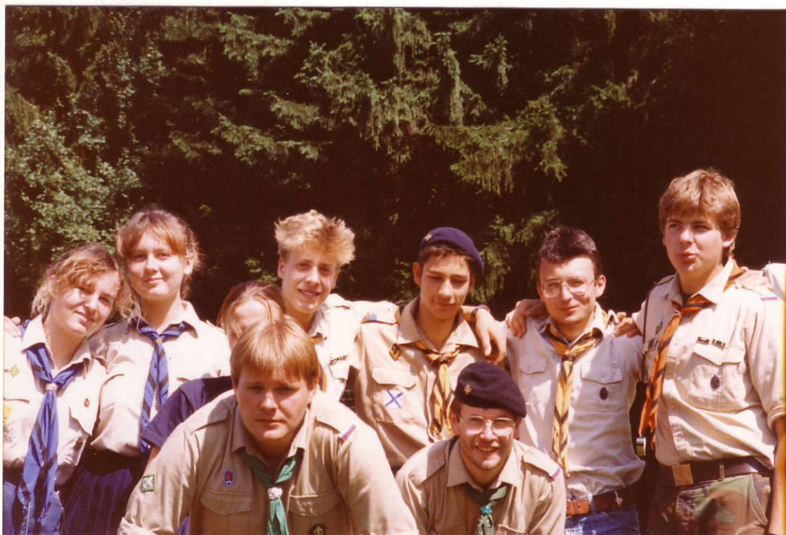
и те, на ком держится вся программа лагеря