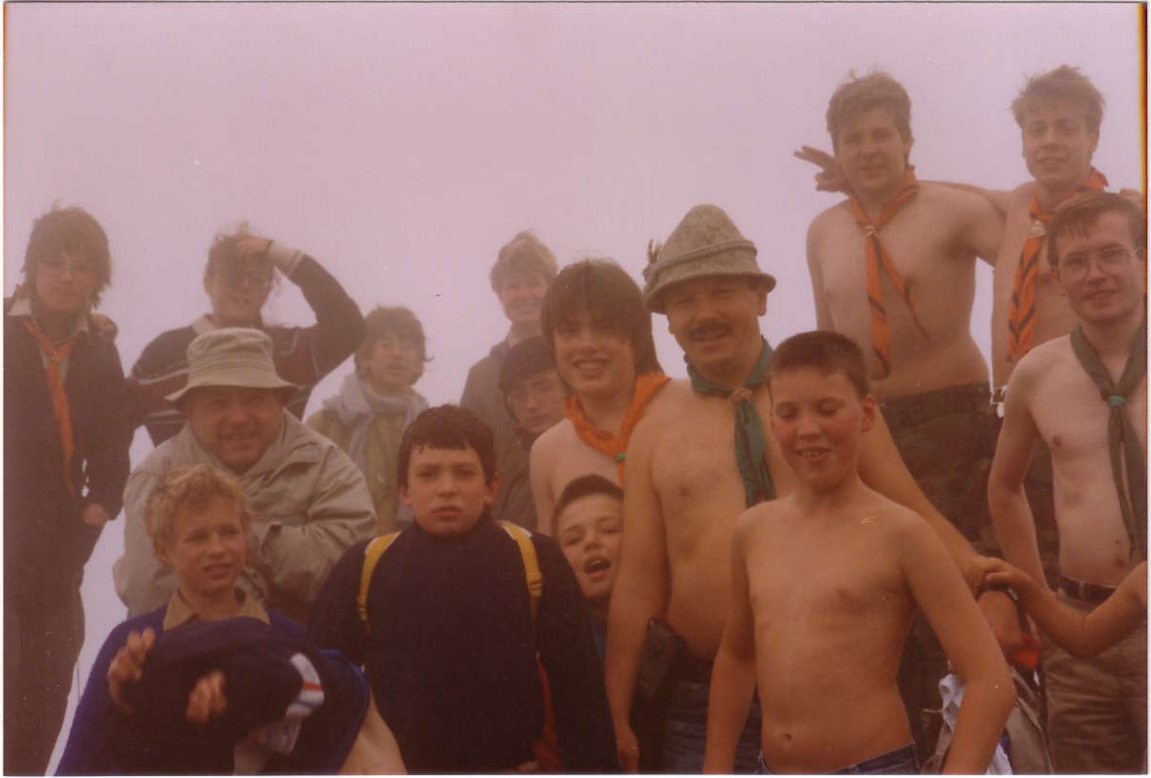
Мерзнущие лагерники на вершине горы Лузен