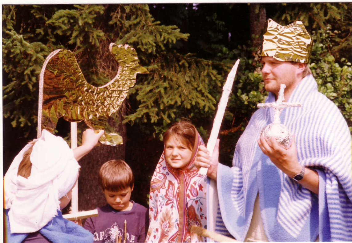
.. и вынул из мешка Золотого Петушка ..