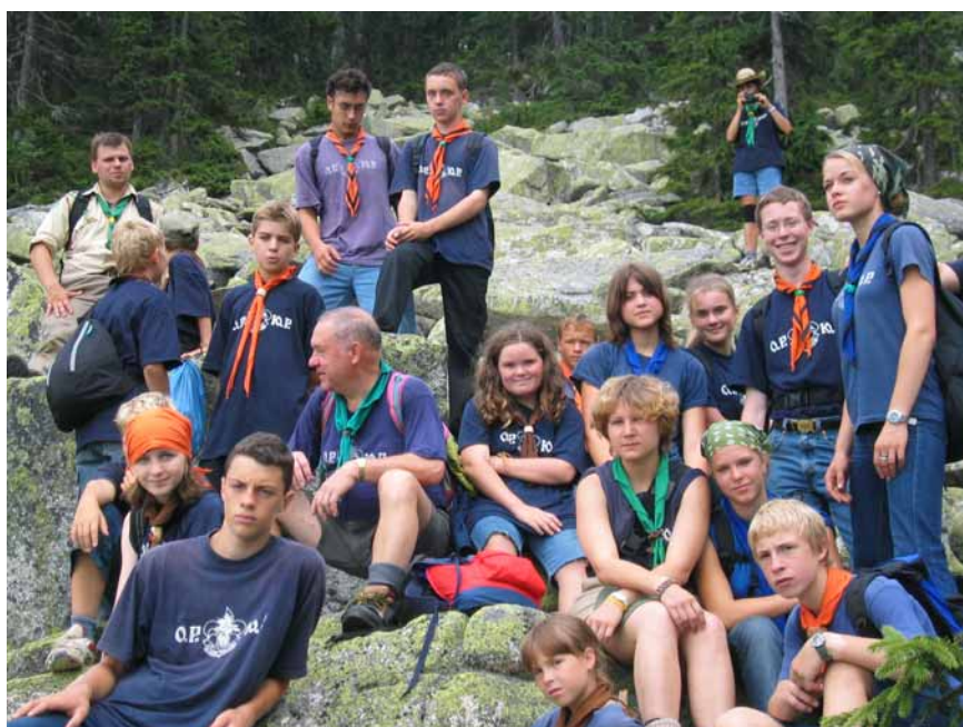
Общий лагерный поход по знаменитому «Каменному морю», недалеко от стыка трех стран – Германии, Австрии и Чехии,