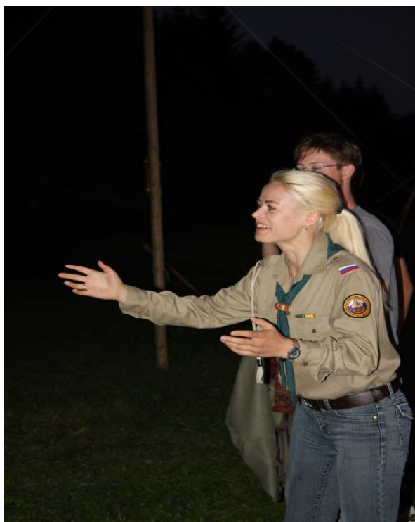
Дежполаг Ромашка «командует строем»