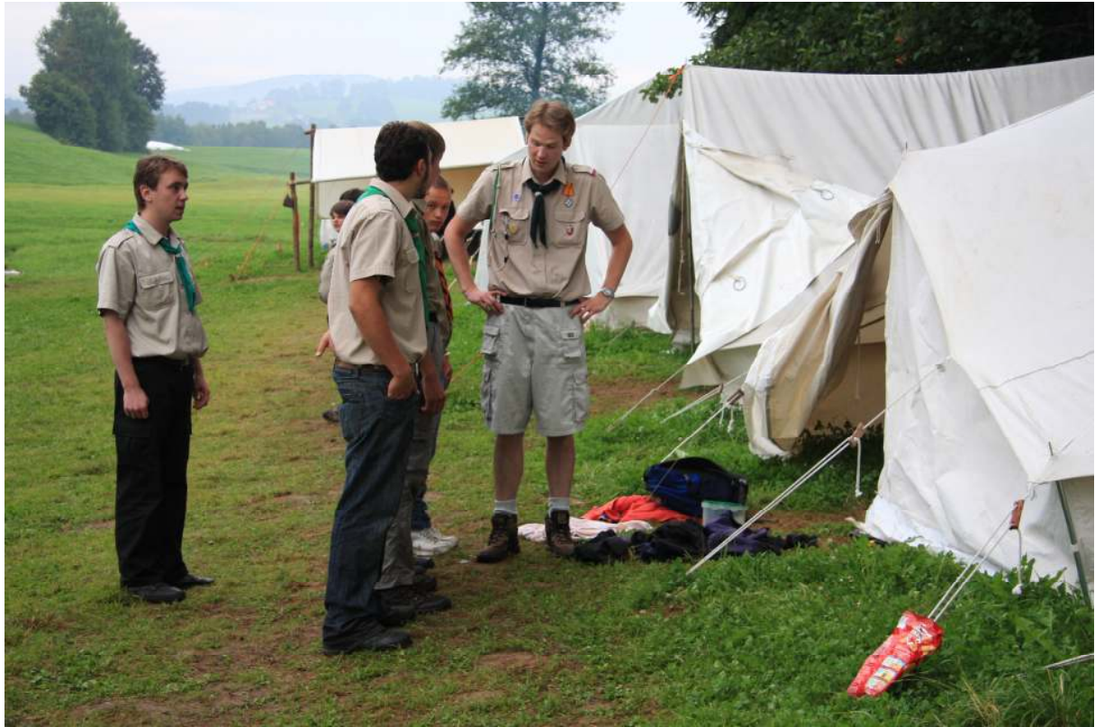
... результат смотра ...