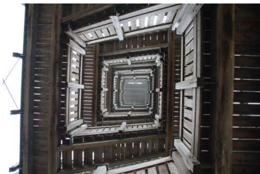
Что это за конструкция знают только