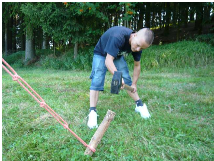
используя тяжелые «орудия труда»