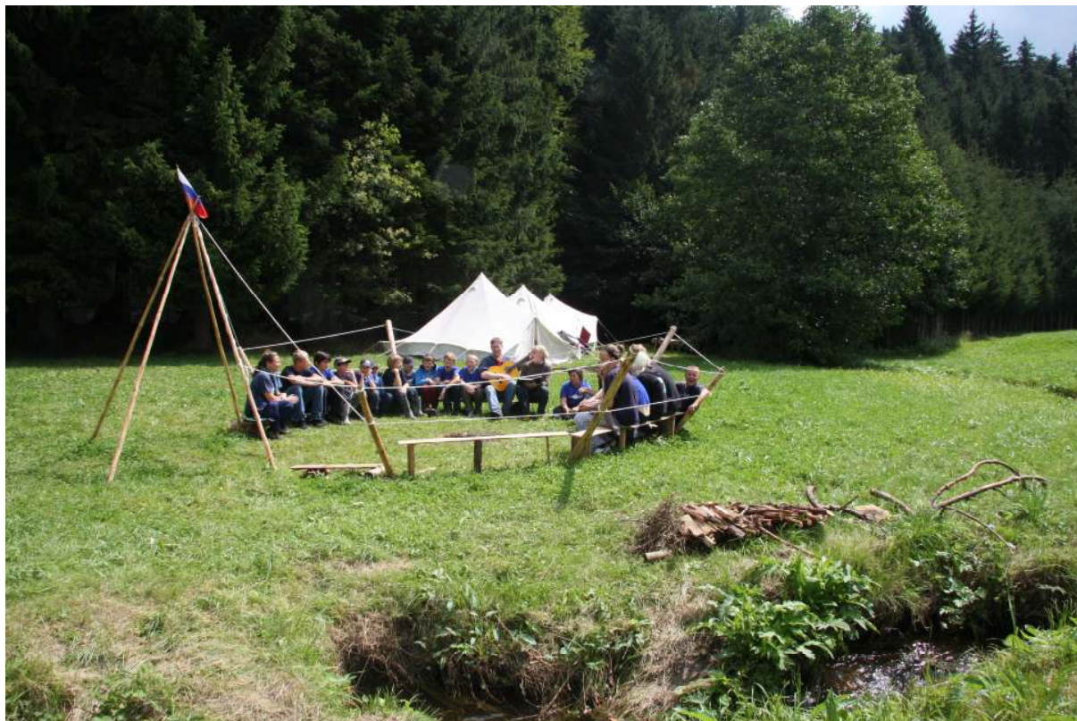
Спевку проводит наш музыкальный Горноста́й – стр.р-к Матю́ша Шли́ппе