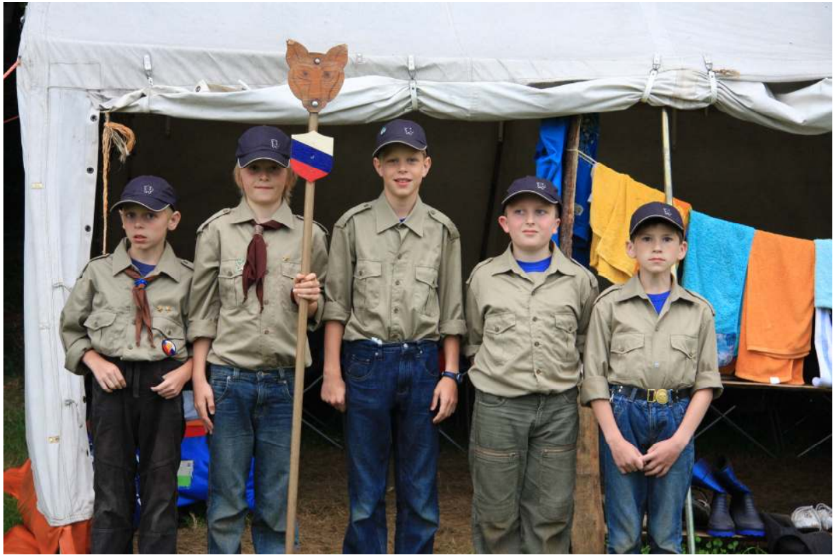
Лагерь построен, звенья разместились по палаткам и приготовились к смотру ...