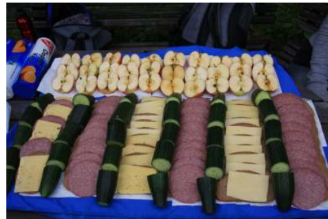
хорошо и закусить у конечной цели.