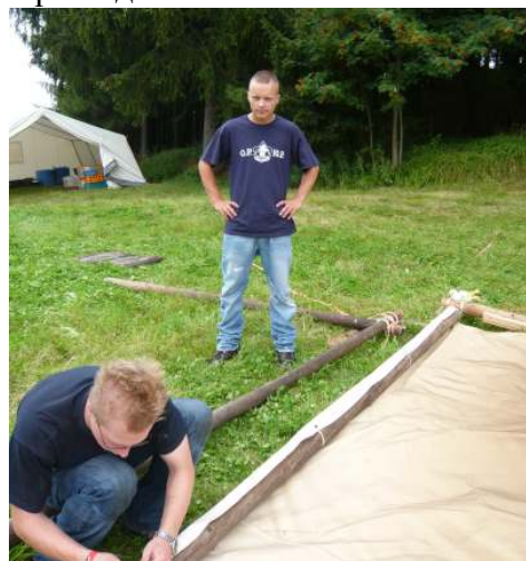
а также Динго - стр.раз-ку Паше Перуцци

применяя свой опыт, умение и старание, приходится немало потрудится под «зорким оком» Баклана