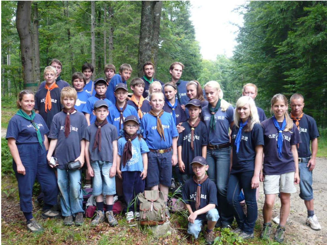
В походе по «дебрям» Баварского Леса