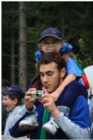
После «трудного» подъема