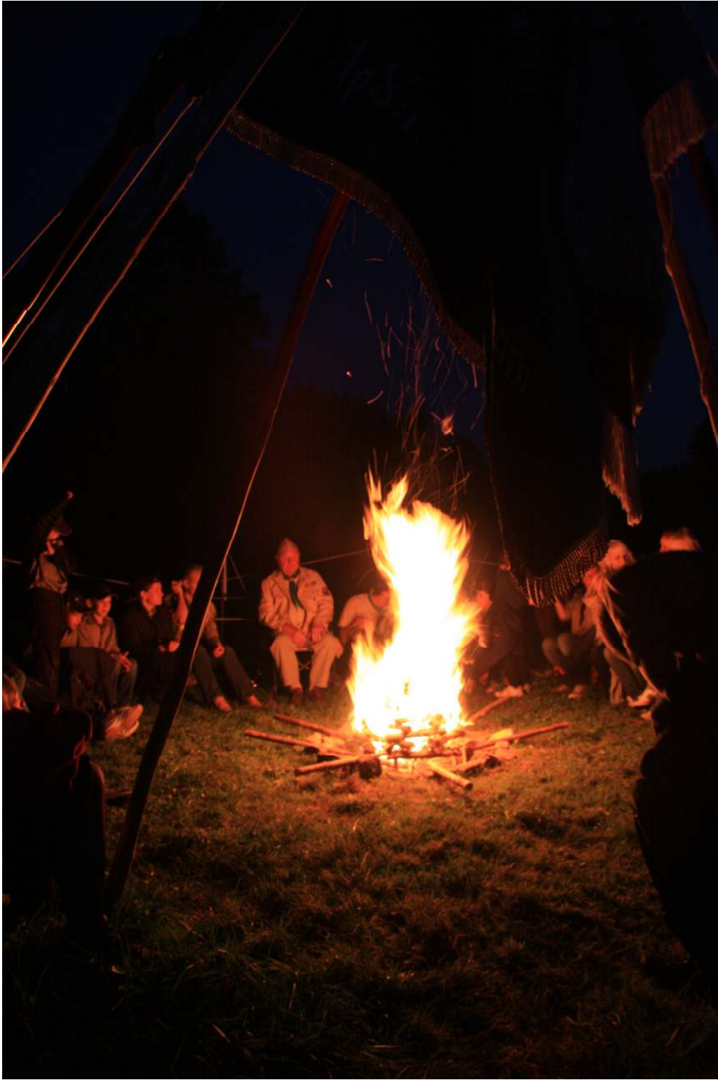
с заключительным тематическим костром.