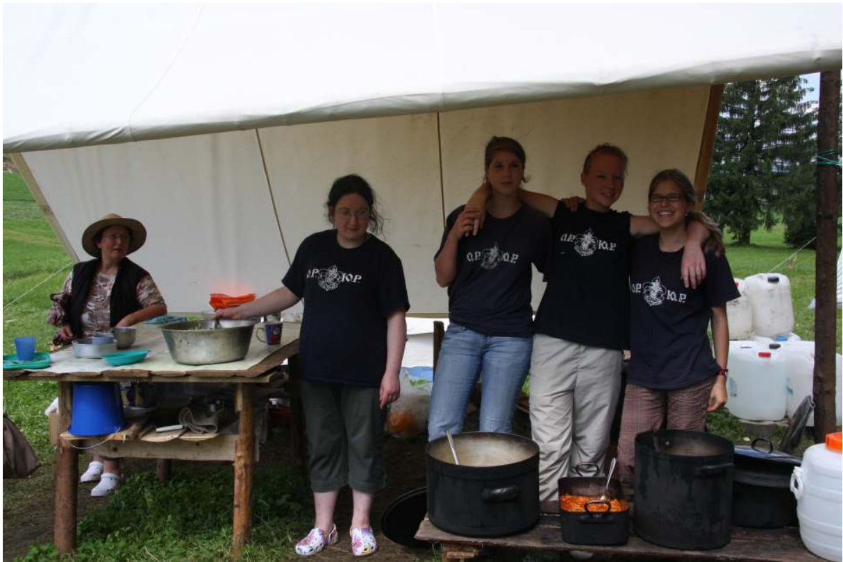
У «источника ароматных запахов» проголодавшихся лагерников встречает приветливый кухонный персонал,