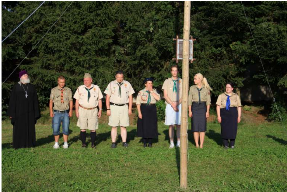
и особая церемония