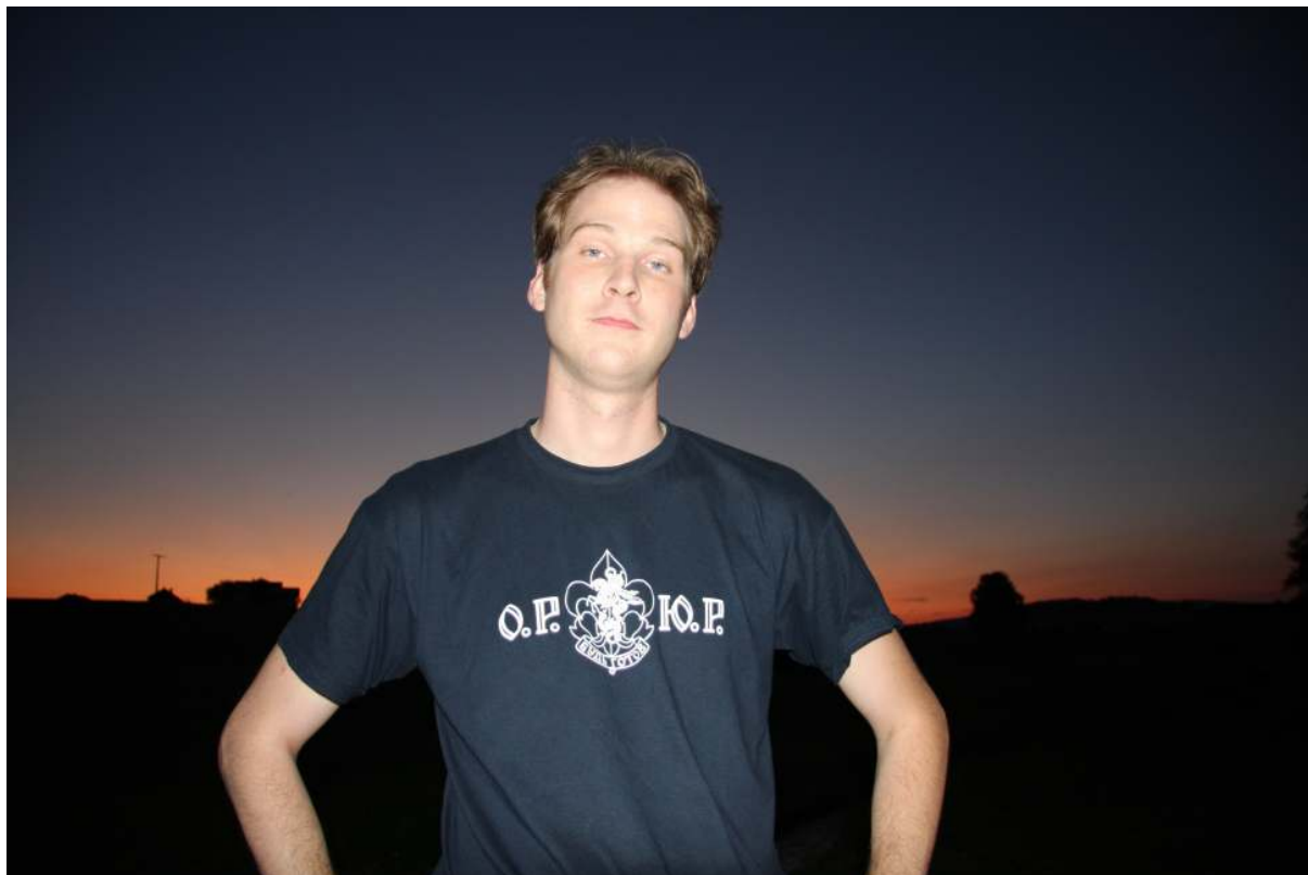
... всегда веселый и «бодрый» Фазан