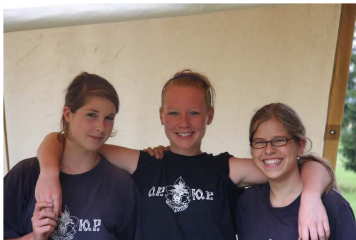
с гордостью демонстрируя состряпанную ими «ужасно вкусную еду» (выражение одного волчонка).