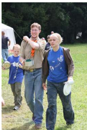
«Обед !» - самая популярная и самая быстро волняемая команда ...и