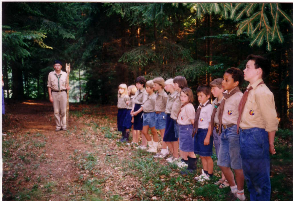
Напряженный момент перед Обещанием белочек и волчат