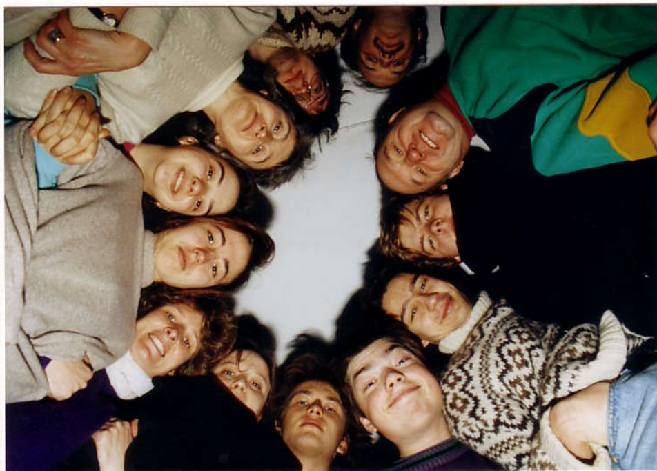
Соответственно сплочен был и дух лагерников ...