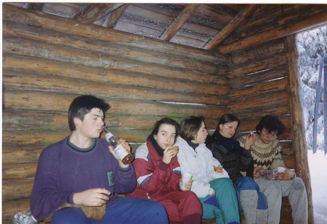
Несмотря на разведенный костер в хижине на вершине Хайделя, суровый климат Баварского леса не позволил утомленным лыжникам долго наслаждаться вкусным обедом