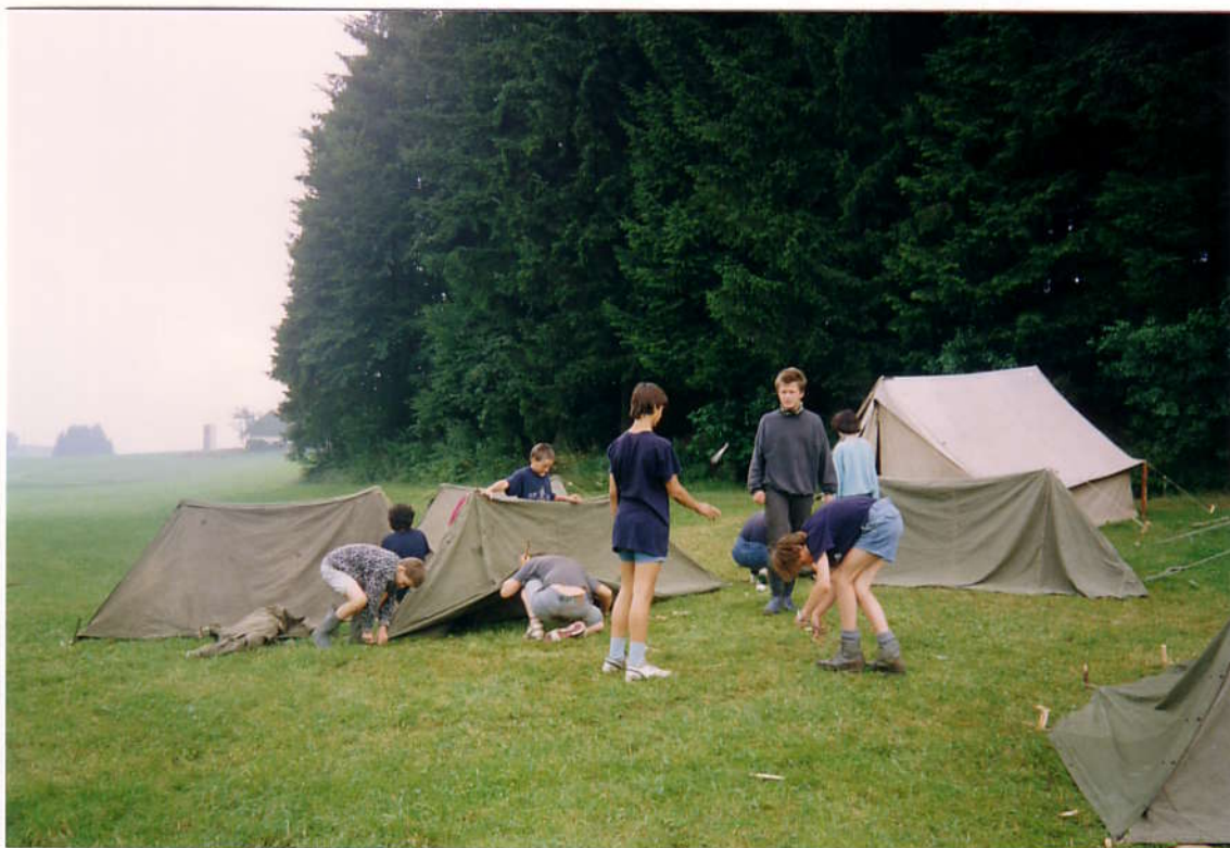
Практика 3-го разряда - умело и быстро поставить палатку.