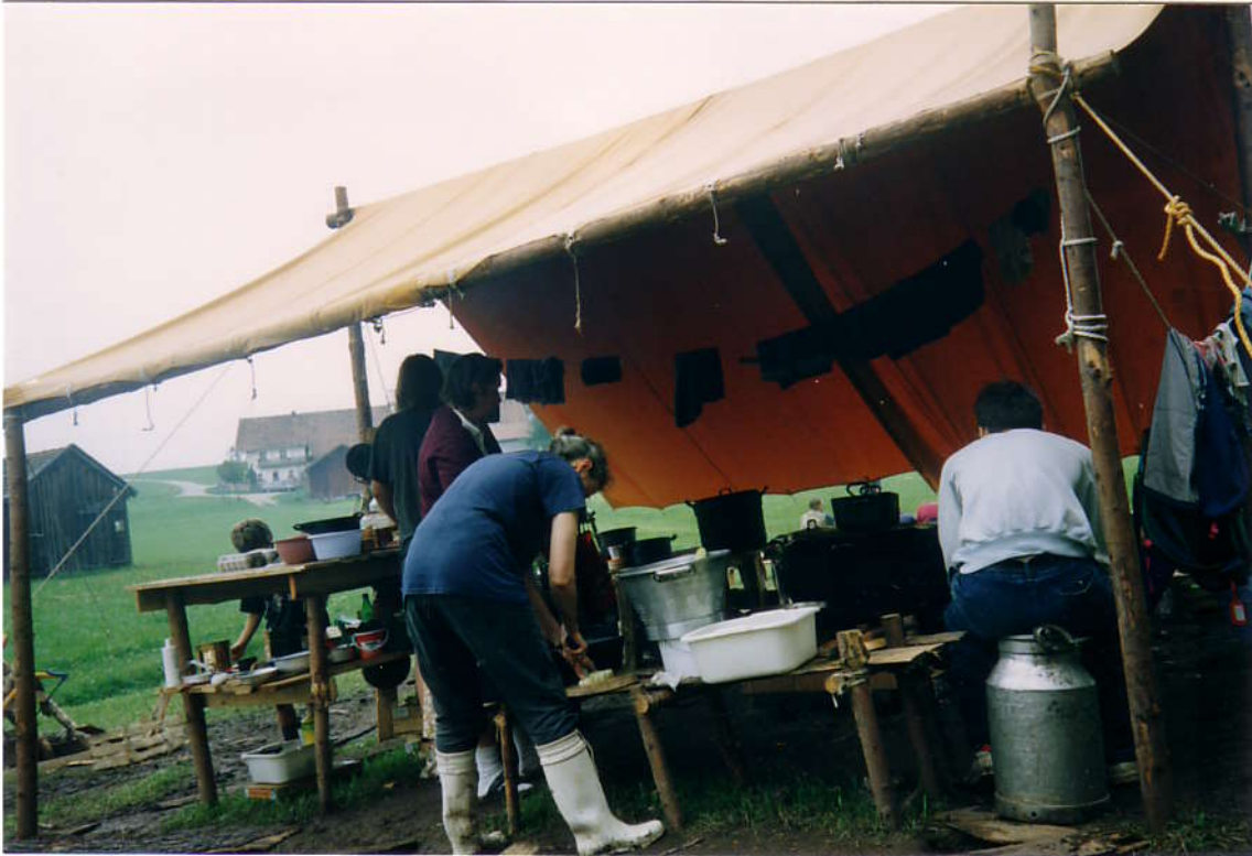
Лагерная кухня со всеми удобствами (если уметь ими пользоваться).