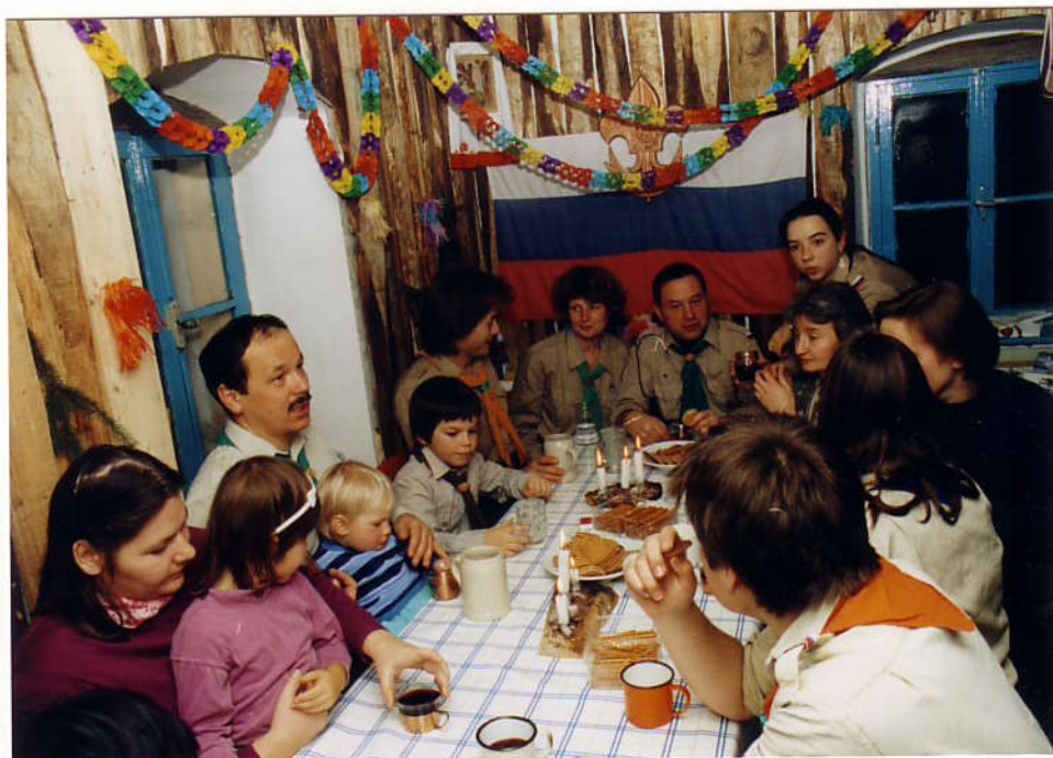
Угощение в новогоднюю ночь

была сказочной. Правда, в первый день, на лыжне мокрый снег и сильный ветер нас порадовали, но на этом удовольствие и кончилось. Все последующие дни светило солнце, легкий морозец приятно пощипывал щеки, снегу было вдоволь.