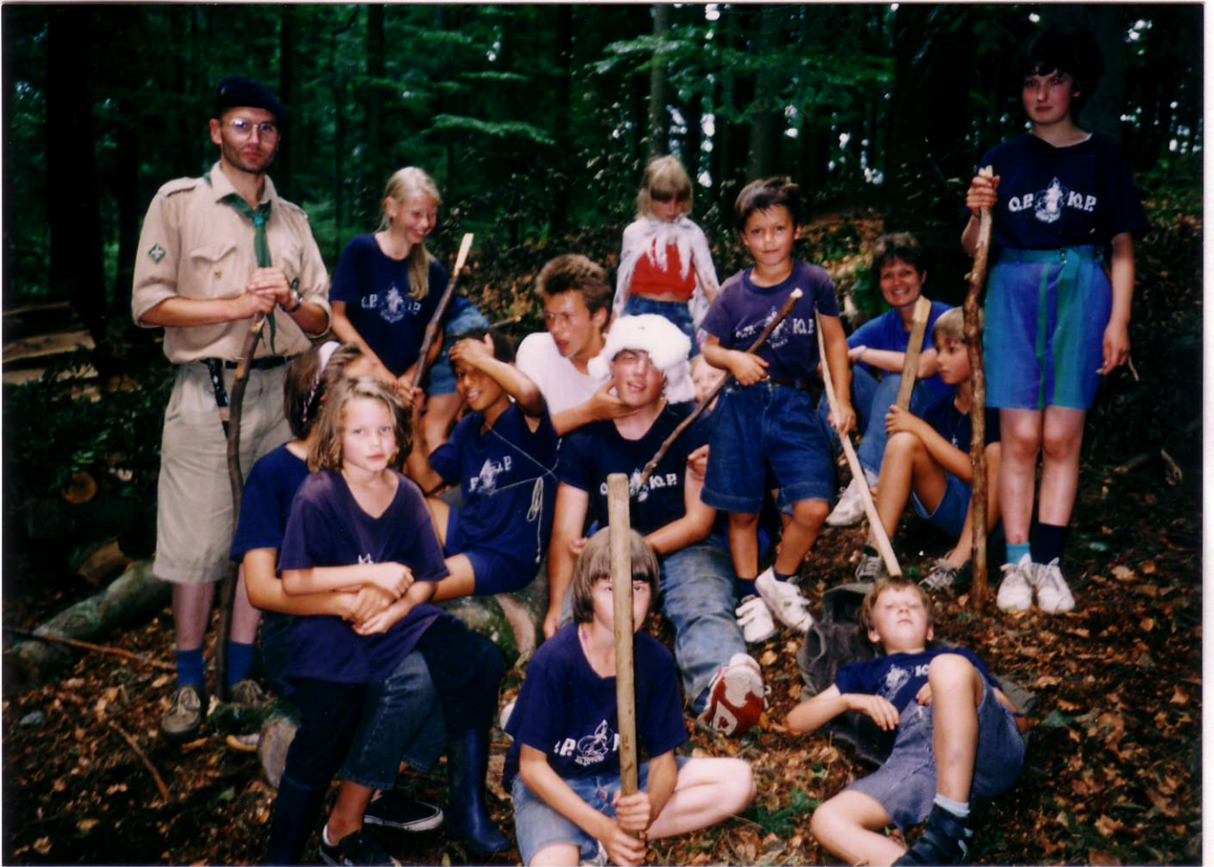
Стя после "Битвы под Полтавой" с пленным шведским королем - Зайчиком.