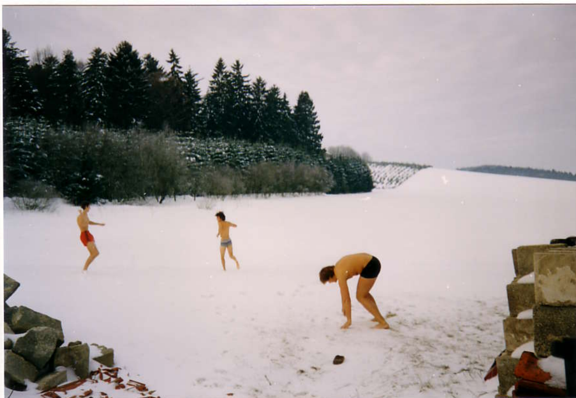
Утренняя зарядка или переизбыток энергии