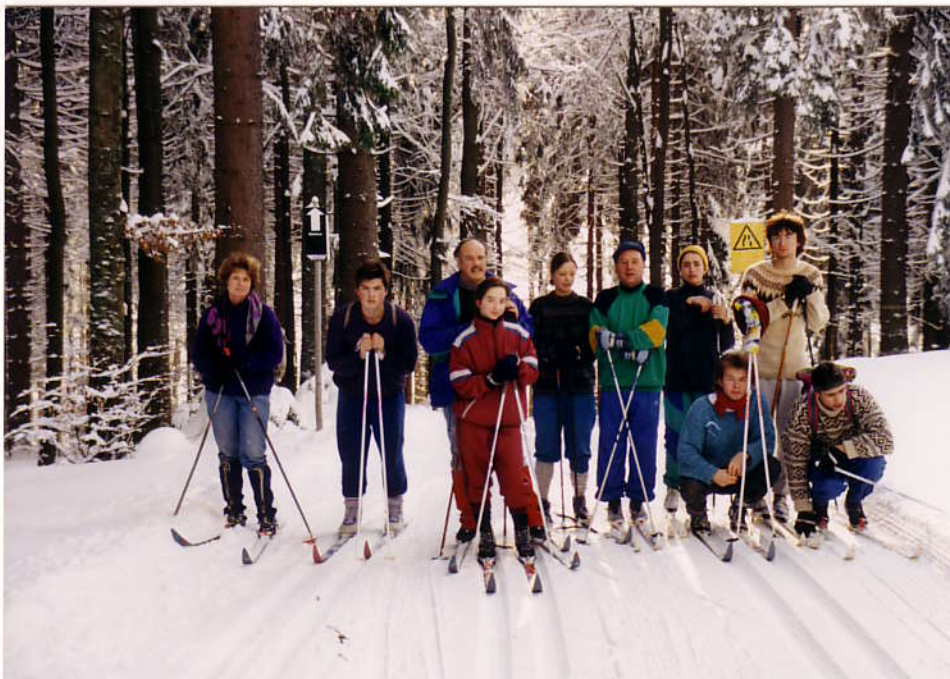
Перед началом трудного подъема по знаменитой лыжне на Хайдель