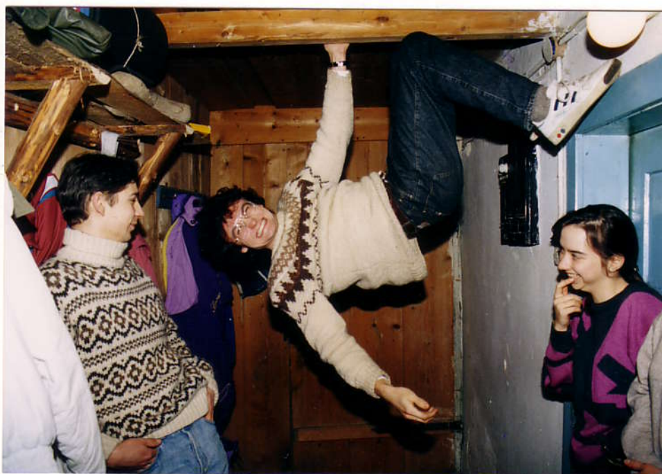
Наш опытный скалалаз Пингвин не упустил ни одной возможности потренировать мускулы