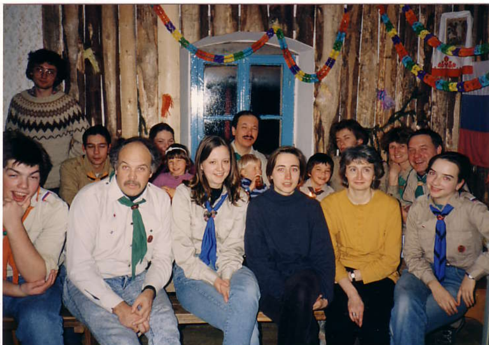
В последний вечер 1991 года