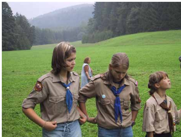
Лагерь выстраивается к подъему флага