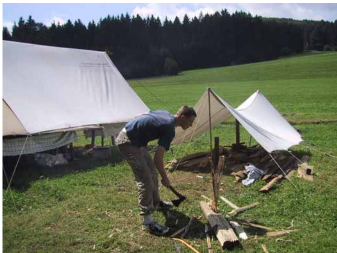
Не очень упоая на помощь своих товарищей по звену, вожак Матюша решил собственноручно заготовить с избытком топлива для кухонного очага.