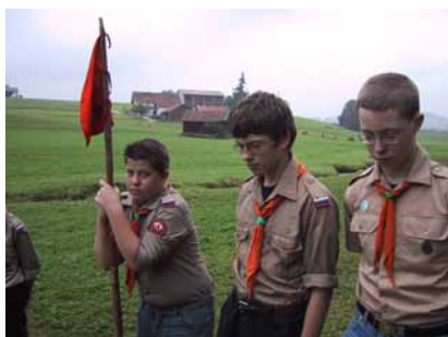
а Арис и тут, как видно, придумал еще один способ пользования звеновым флажком.