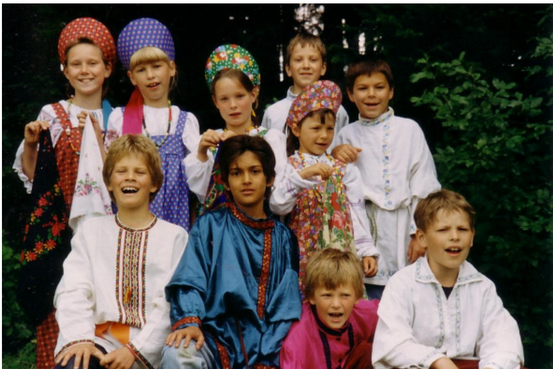
Обитатели града Китежа